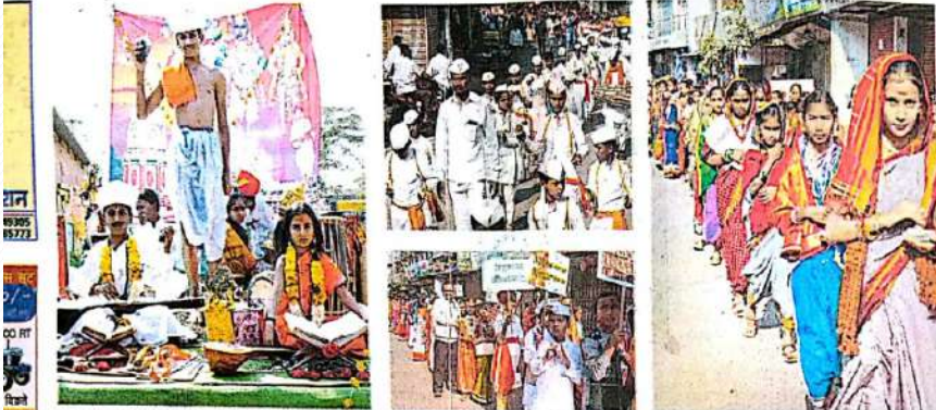
उस्मानाबाद : जिल्हा परिषदेच्या पहिल्या बालकुमार साहित्य संमेलनाच्या उद्घाटन सोहळ्यात आलेल्या प्रबंधदिंडीत संधीच्या वेदाभूषेत सहभागी विद्यार्थी. (दुसऱ्या छायाचित्रात) टाऊन-मुंबगावा गावा कडील बाळकृष्णांच्या वेदाभूषेत सहभागी झालेले विद्यार्थी. (तिसऱ्या छायाचित्रात) फलक हत्ती घेतलेले विद्यार्थी. (चौथ्या छायाचित्रात) प्रबंधदिंडीत सहभागी विद्यार्थी.