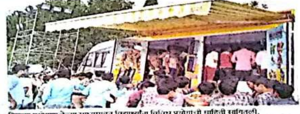
शाल्या प्रयोगशाळेच्या माध्यमातून विद्यार्थ्यांना विविध प्रयोगांची माहिती सांगितली.