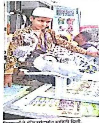
विद्यार्थ्यांनी इजिनसंदर्भात माहिती दिली.