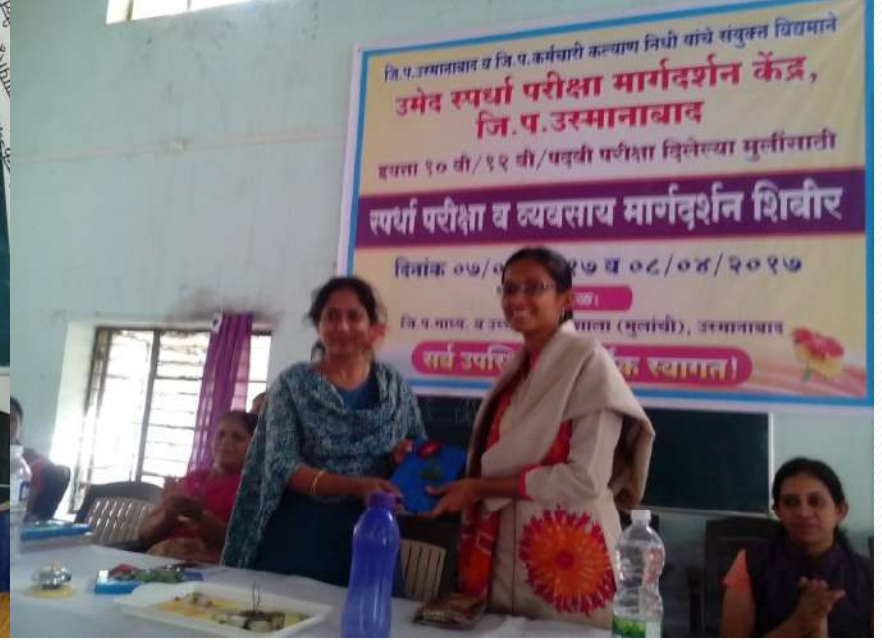
उमेद स्पर्धा परीक्षा मार्गदर्शन केंद्रामध्ये व कार्यकारी समितीच्या बैठकीच्यावेळी यशवंत मुलींचा सत्कार प्रसंगी