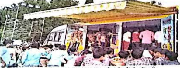
मिळाल्या प्रयोगशाळेच्या माध्यमातून विद्यार्थ्यांना विविध प्रयोगांची माहिती सांगितली.