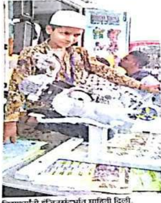
विद्यार्थ्यांनी इजिनसंदर्भात माहिती दिली.