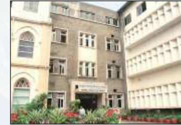
राष्ट्रीय विषाणू विज्ञान संस्था (एन आय व्ही), पुणे