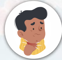
श्वास घ्यायला त्रास होणे