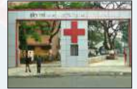
इंदिरा गांधी वैद्यकीय महाविद्यालय नागपूर