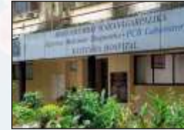
कस्तुरबा मध्यवर्ती प्रयोगशाळा मुंबई